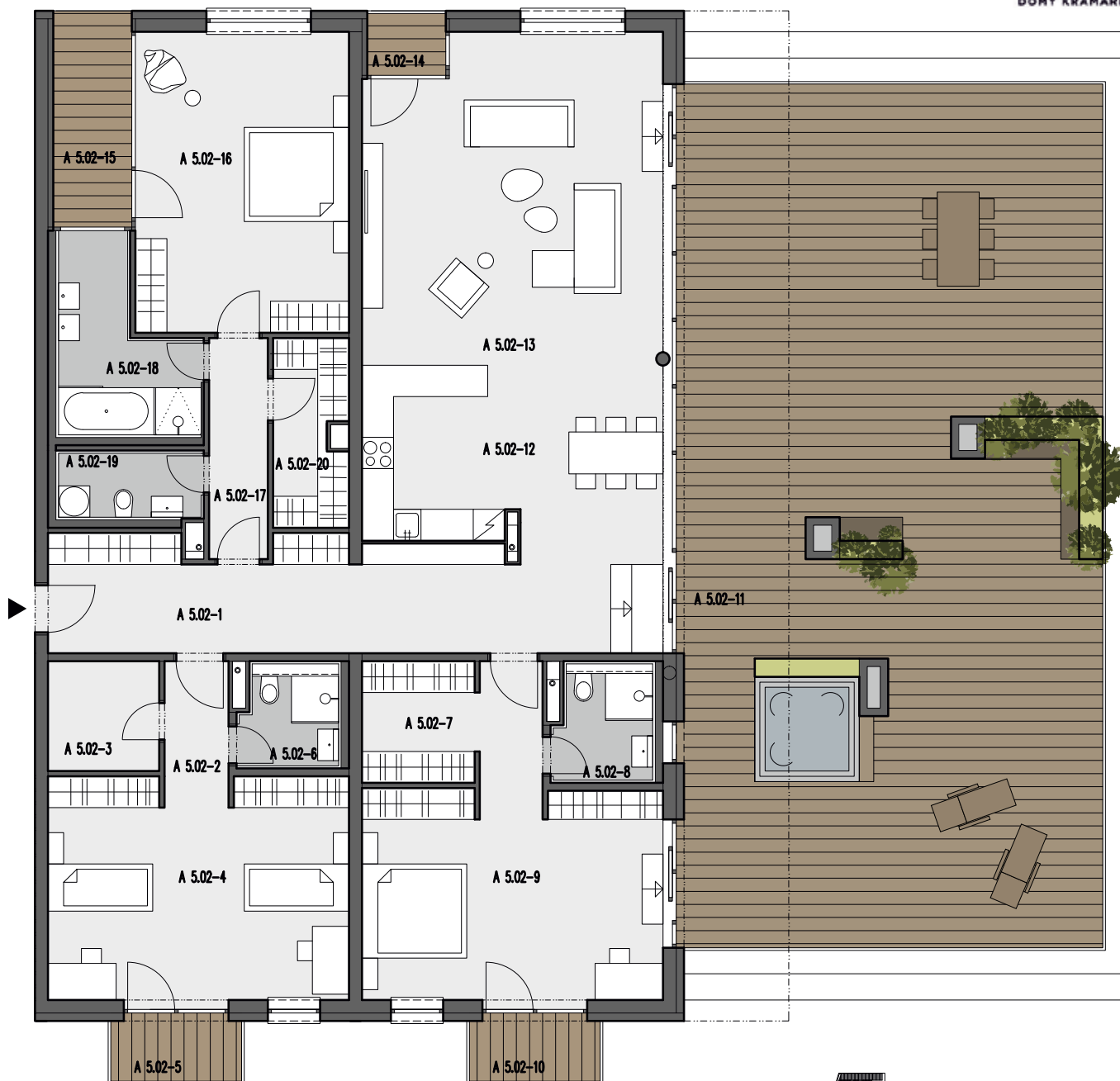
A5.02 BYT / 4 IZBOVÝ / 5.PODLAŽIE